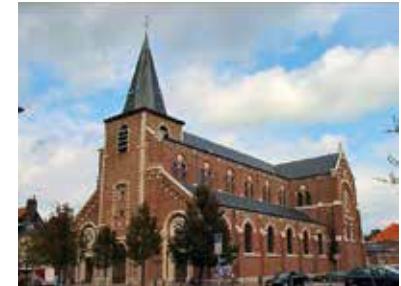
Église de Roncq